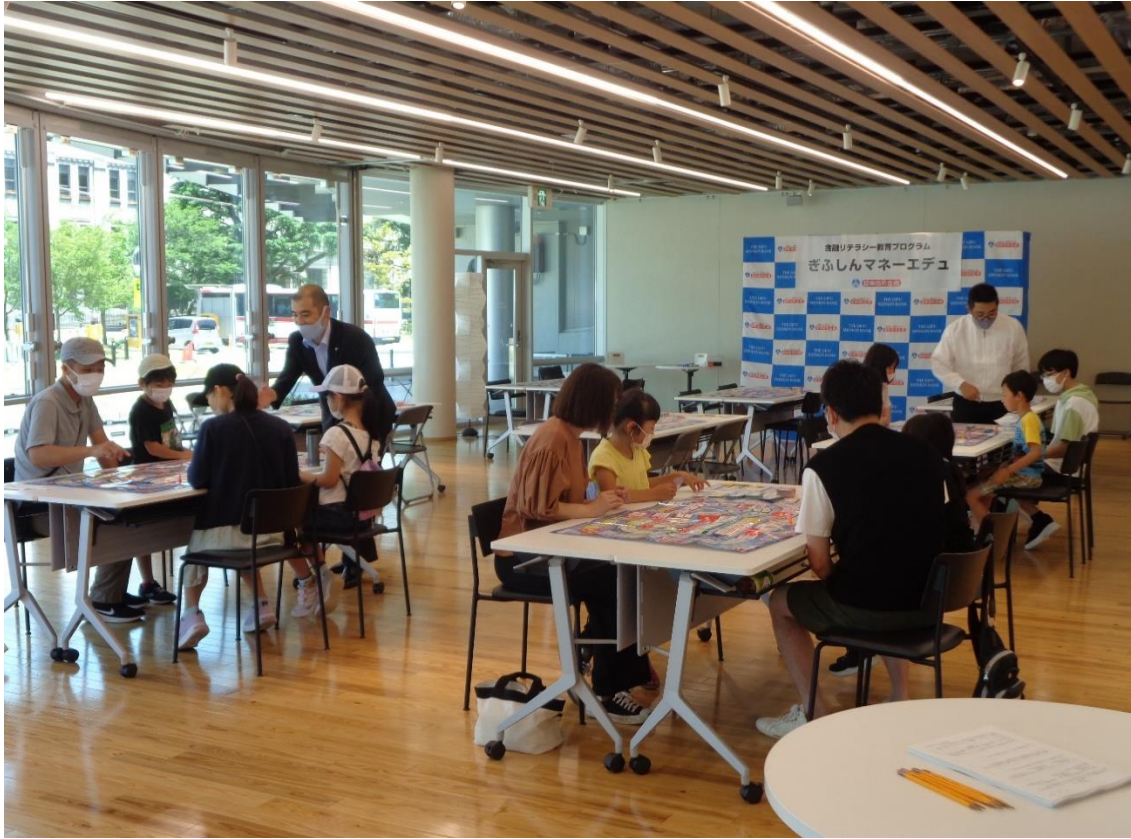
■ 2023年5月20日（土） ランランチマーケットにおけるぎふしんマネーエデュの様子