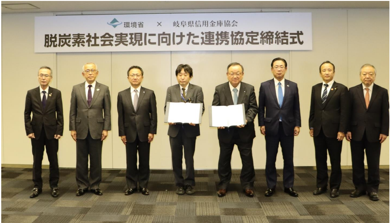
中山所長、住田会長及び県下6信用金庫の出席者