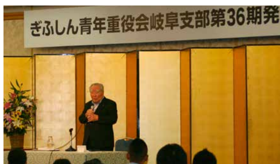
ぎふしん青年重役会 岐阜支部 第36期発会式の様子