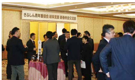
ぎふしん青年重役会 岐阜支部 新春例会交流会の様子