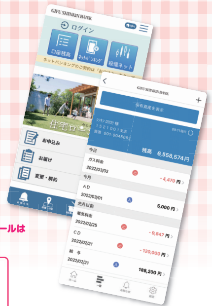
▲保有資産照会の画面