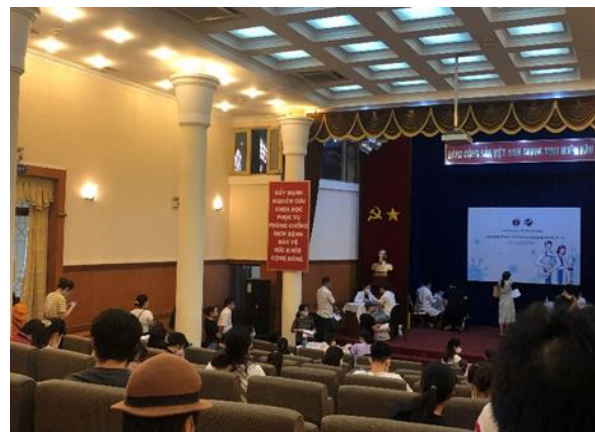
【ベトナム国内でのワクチン接種の様子】

一方、政府は、ワクチン接種した外国人に限り、ベトナム入国時の隔離期間を14日間から7日間に緩和することを発表しています。ベトナムは、勤勉な国民性で知られており、今後の経済成長が期待でき、投資に魅力的な国です。ベトナム全域でワクチン接種が進み、一日も早い感染の終息と海外からの投資の回復を願っています。