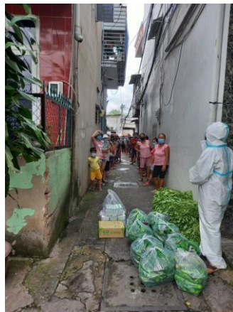
【食料品配給の様子】

また、市や区をまたいで移動する際は検問が行われており、通勤の場合は通勤証の提示が求められています。一部地域では生活必需品を購入する際に、ベトナム政府が発行する整理券の提示を求められる場合もあります。